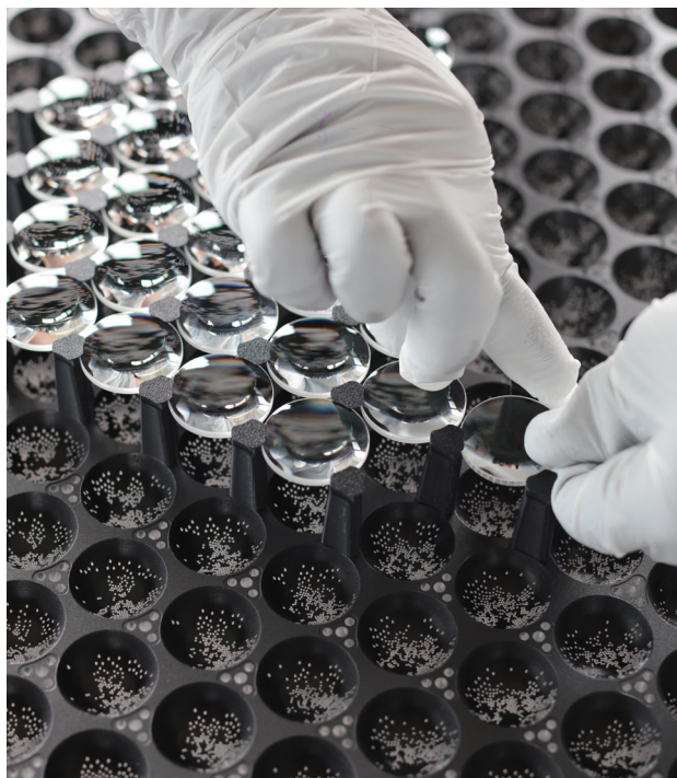
Unread Characters Serie 2 Type 1 © Gallery Shilla, Kimchi & Chips, 2025.