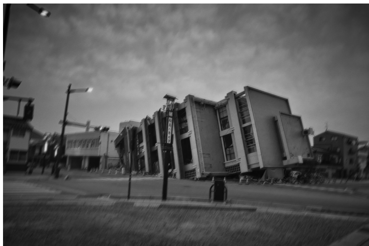
Alain Willaume / Tendance Floue

L'ouvrage scelle ainsi une vision commune de l'image, où l'excellence technique se met au service de l'émotion pure.